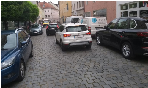
Zustand der Obermünsterstraße heute mit viel Parkplatzsuchverkehr.

Der Obermünsterplatz mit einer Fläche von fast 1.000 m 2 muss entsiegelt werden – wie schön wäre er als Rasenfläche mit Bäumen und Sitzbänken! Bereits 2011 wurde dazu ein Konzept erarbeitet, das vorsieht, die Anwohner- und Parkscheinparkplätze im Parkhaus am Petersweg unterzubringen. Dann hätte man mehr Platz für Grün, Fußgänger und Außen-gastronomie - und weniger Parkplatzsuche! Dieses Konzept möchten wir wieder aufgreifen und die Umsetzung fordern.