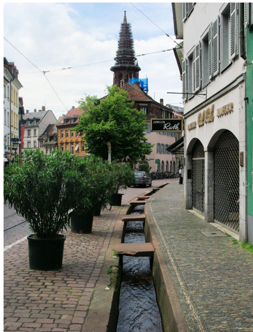
In Freiburg macht man es uns vor: Auch in der Obermünsterstraße könnte der Vitusbach wieder oberirdisch fließen.