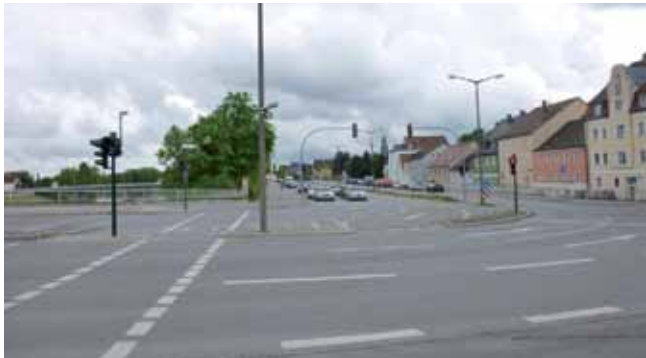
Rückbau der Bayerwaldstraße!