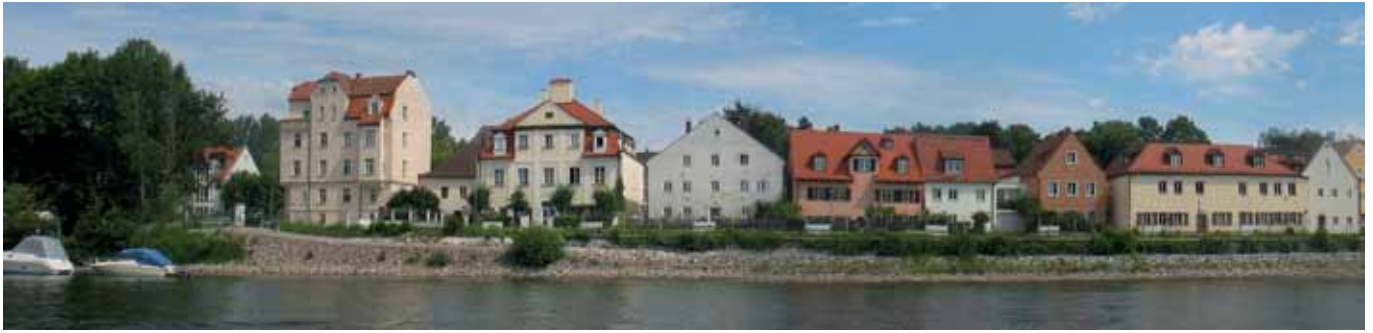
Panorama Badstraße am Oberen Wöhrd

Der Hochwasserschutz an der Bad- und Lieblstraße muss in Absprache mit den Anwohnern sehr sensibel in das Straßenensemble eingebunden werden. Es ist notwendig, bereits vor der Planung mit den Anwohnern in geeigneter Weise Kontakt aufzunehmen.