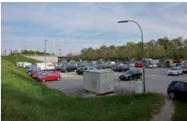
Großparkplatz, Altes Eisstadion

Am Donauufer sollen Schiffsanlegestellen für die Ausflugs- und Eventschiffe errichtet werden. Ein Busterminal für die Benutzer der Ausflugs- und Eventschiffe und des Museumsquartiers soll am Gelände angelegt werden.