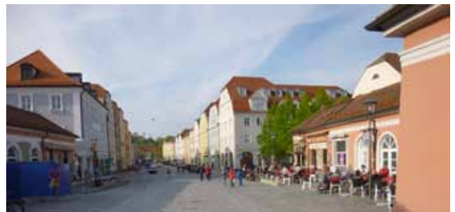
Brückenbasar Stadtamhof (Verkehrsfrei)