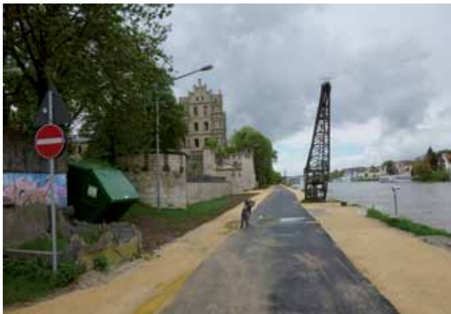
„Autobahn“ an der Donaulände, Villapark