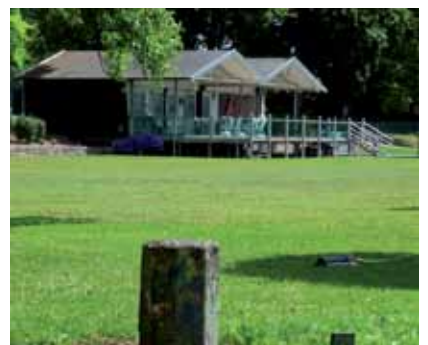
Obere Bildreihe: Ursprüngliche Vegetation am Oberen Wöhrd beim jetzigen Motosboothafen Untere Bildreihe: Gerodete Flächen für den Motorboothafen