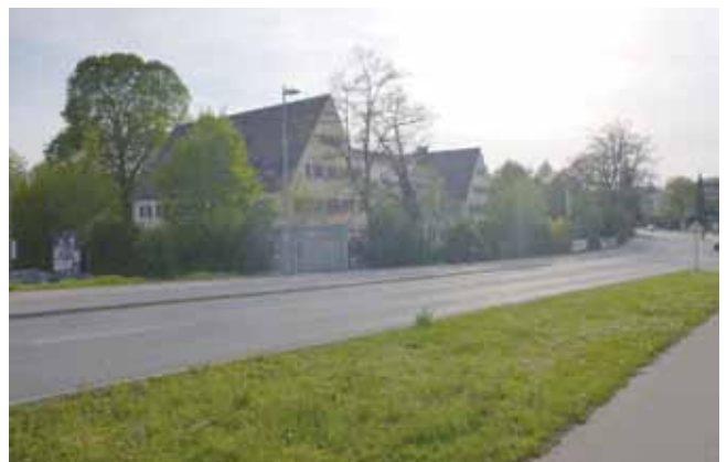
Jugendherberge Unterer Wöhrd