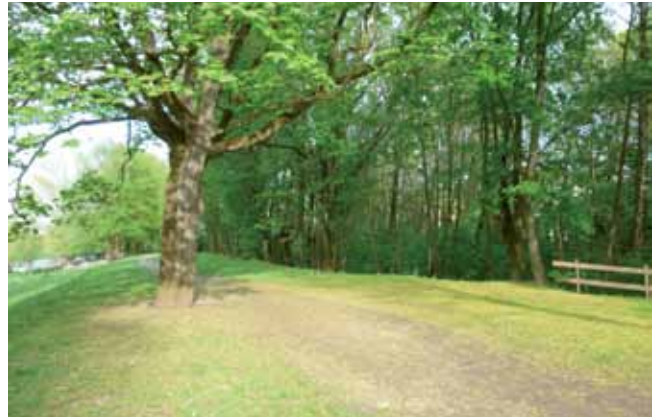
Auwald am Jacobi-Gelände