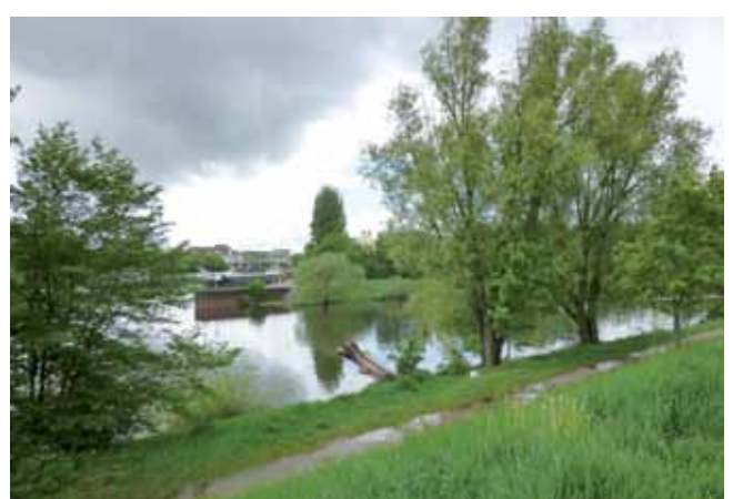
Zusammenfluss von Donau und Regen