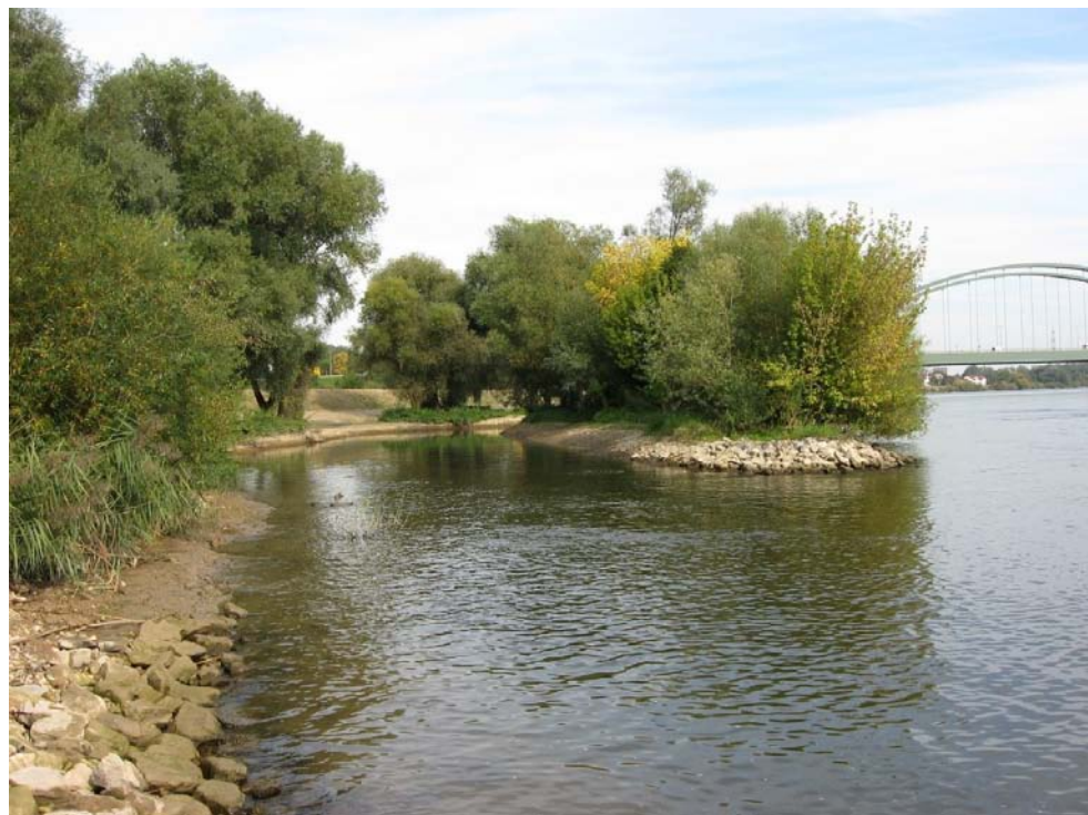
Bei Schwabelweis wurde im Zuge des Hochwasserschutzes ein Seitenarm der Donau angelegt. Es hat sich gezeigt, dass dies einen wertvollen Beitrag zur Bewahrung der Artenvielfalt geleistet hat. In diesem Seitenarm finden sich in großer Zahl seltene Fischarten.