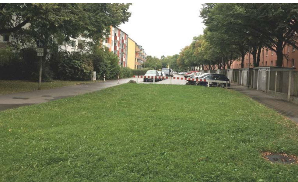
Der grüne Korridor am Burgunderring wartet auf seine Fortführung